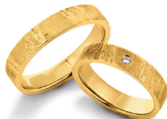
132-N18 San Gottardo