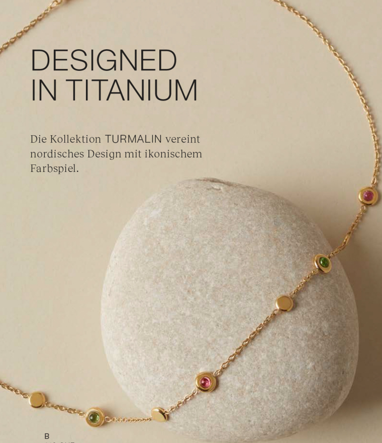
B 219 CHF

Die Kollektion TURMALIN vereint nordisches Design mit ikonischem Farbspiel.