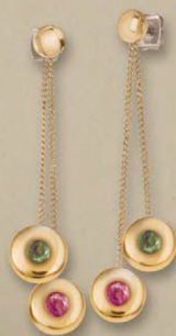
A 149 CHF

A OHRSTECKER 05052-02 Titan, goldplattiert 4 Turmaline ca. 0,6 ct/Paar